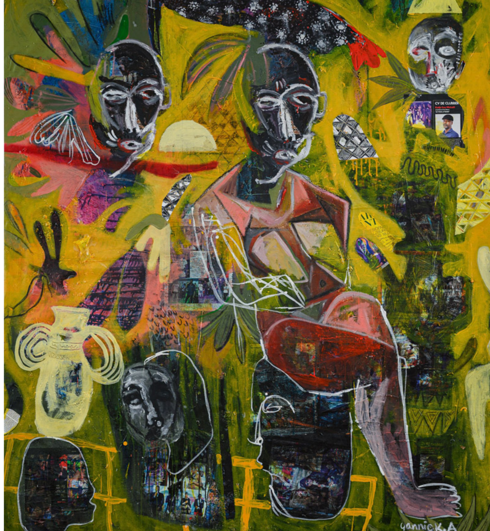
Yannick Ackah, The Guardians of Memory (2026), Acryl, Kreide sowie Collage aus Zeitungspapier, Papier und Stoff auf Leinwand, 180 x 150 cm.

Spannend ist vor allem deren Vielfalt: Unter hohen Decken versammelt die Kunsthistorikerin farbstärke Abstraktionen des Ivoeren Yannick Ackah – Shootingstar der Galerie –, der auf seinen Basquiat-artigen Großformaten afrikanische Masken, Fragmente europäischer Kunstgeschichte und Elemente zeitgenössischer urbaner Kultur verschmelzen lässt. Ackahs Collagen aus Acrylfarbe, Wachsmalstiften, Zeitungsausschnitten und Textilien schaffen haptische Oberflächen, auf denen er moderne Alltagskultur mit traditioneller Bildsprache verwebt.