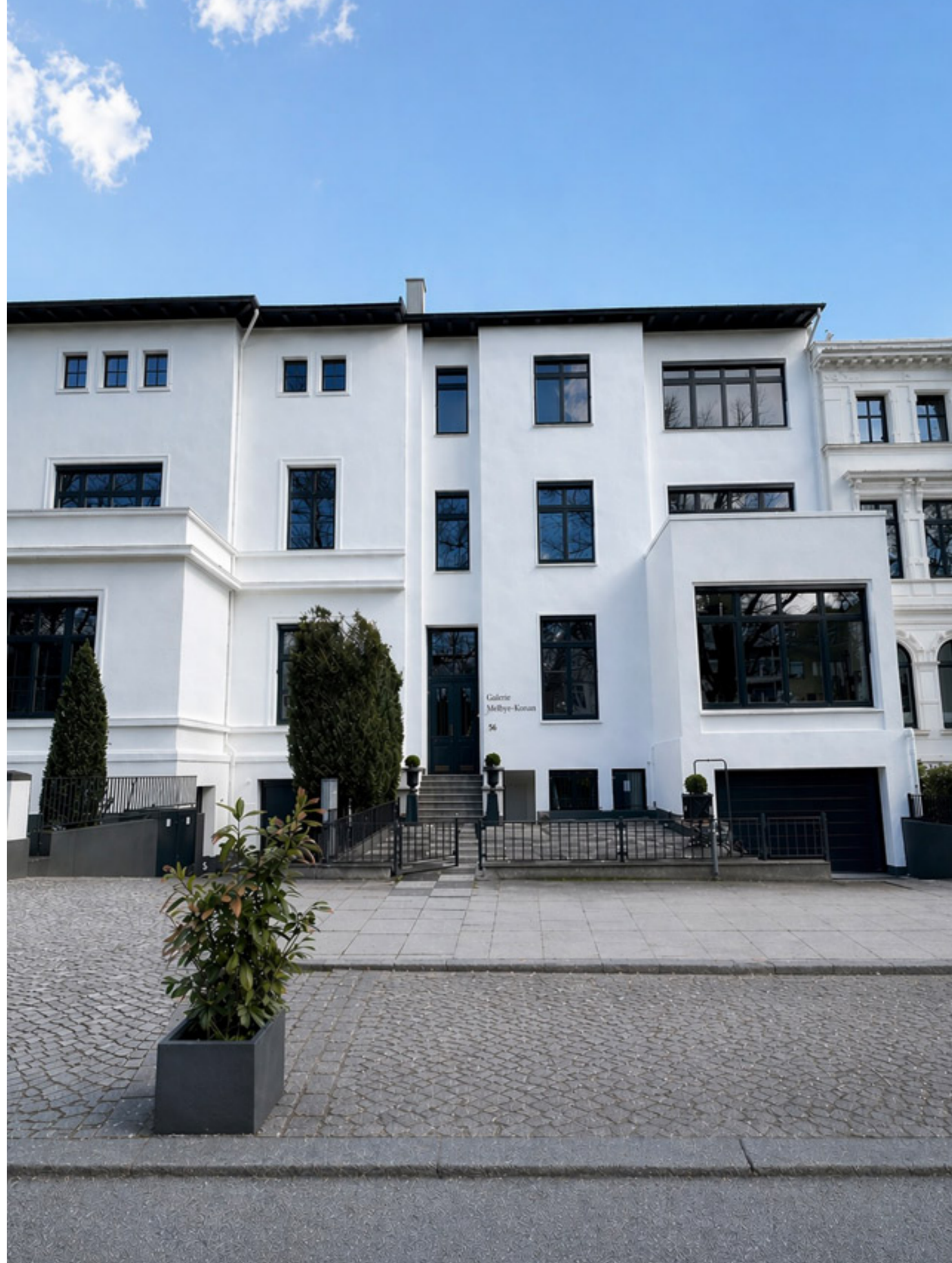
Der neue Standort in der Heimhuder Straße 56.