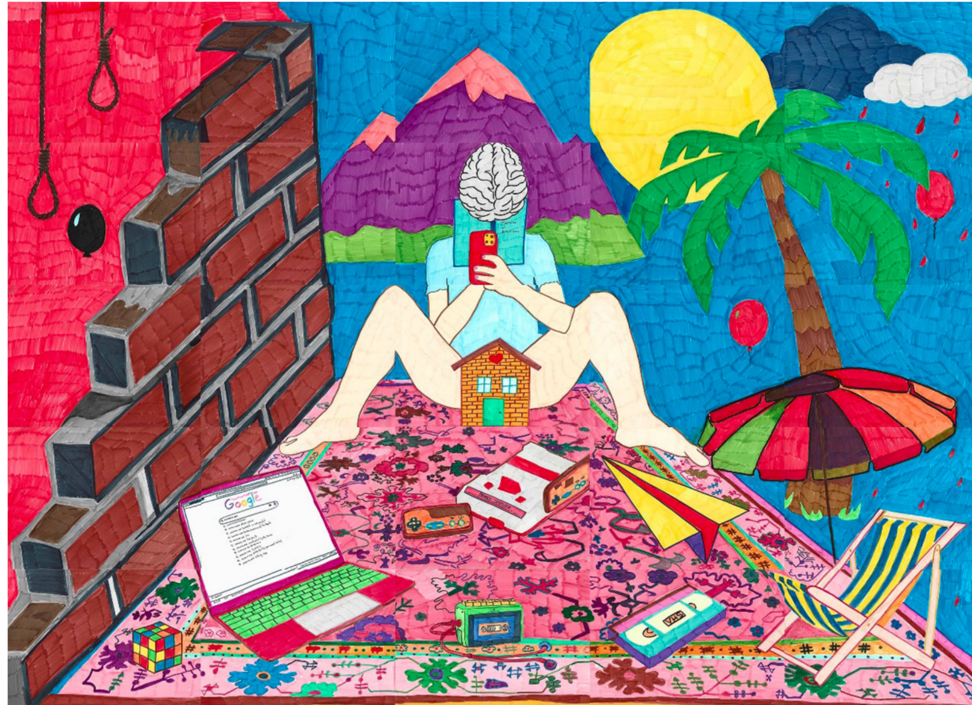
Araks Sahakyan, My Home, My Ghosts, My Memories (2022–2023), Pigmentmarker auf Papier, 25 lose Blätter, 102 x 140 cm.

Im grellen Kontrast dazu stehen die mit Markern gezeichneten Wimmelbilder und Stickerarbeiten der jungen Armenierin Araks Sahakyan.