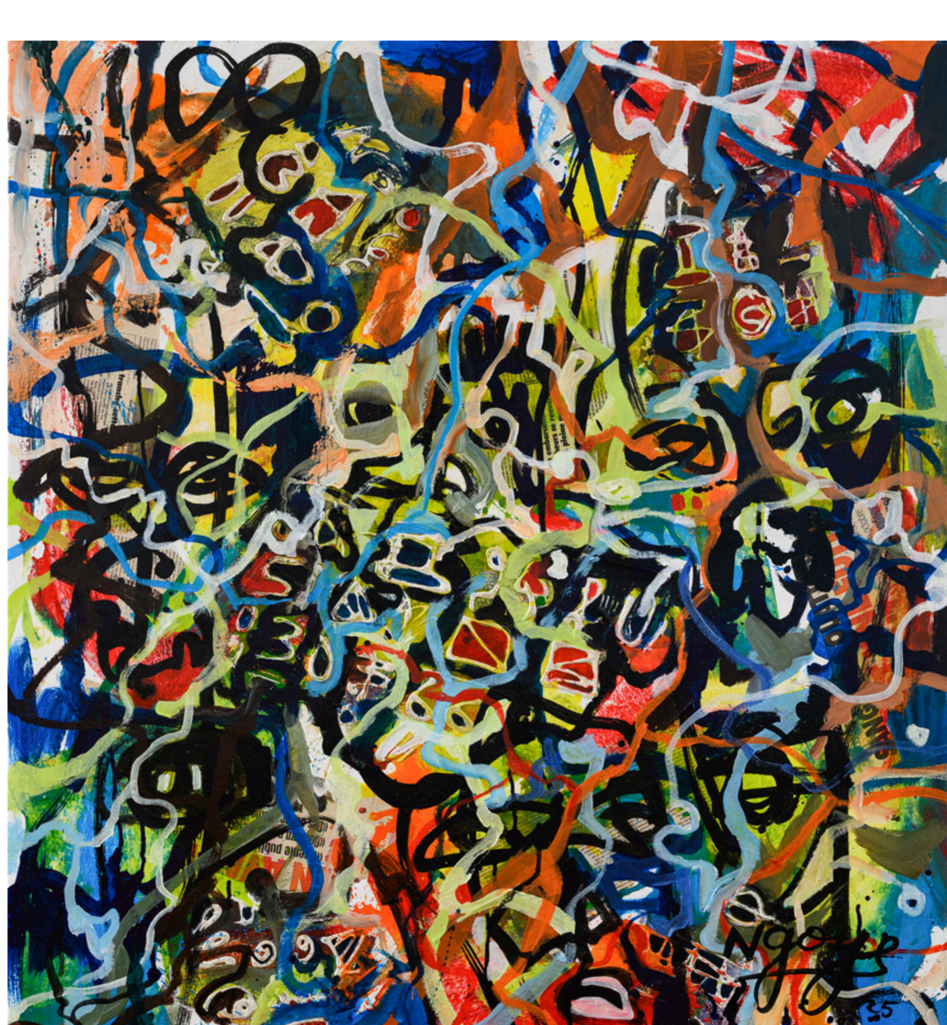
Ngyoye, Untitled aus der Serie „Masquage“ (2025), Mixed Media auf Leinwand, 110 x 98 cm.

Die französische Illustratorin und Filmemacherin Nathalie David wiederum nutzt zarte florale Zeichnungen, um gesellschaftliche Herausforderungen wie den Einfluss der Front National zum Ausdruck zu bringen. Die in Neonfarben strahlenden Leinwände der Schweizerin Stellar Meris erzählen von körperlichen und spirituellen Erfahrungen. Und der Maler Ngyoye von der Elfenbeinküste realisiert eindrucksvolle Abstraktionen durch rastlose, vielschichtige Pinselstriche.