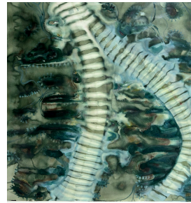
Anna-Belén Siegmann Untitled I, 2024 acrylic on paper 240 x 150 cm

Ebenfalls 2024 wurde Belén die große Ehre zuteil, als Jahrgangsbesterin das renommierte Lucy Halford Bursary Stipendium für ihr Masterprogramm am Royal College of Art in London zu erhalten.