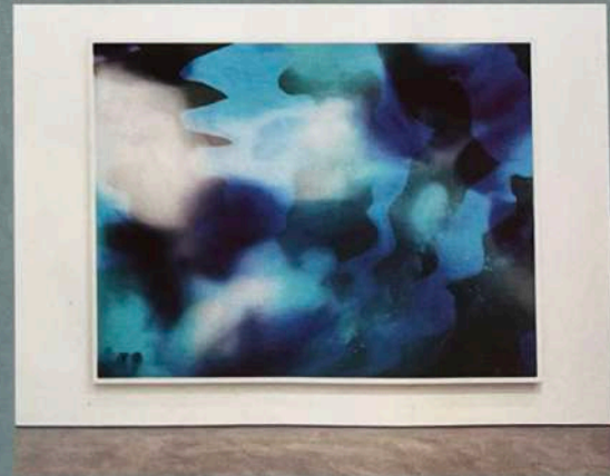
Schwarz Contemporary: JOHANNA JAEGER „repeating accidents (plywood)“, 2022, Pigmentdruck, 146 x 196 cm, 16000 Euro