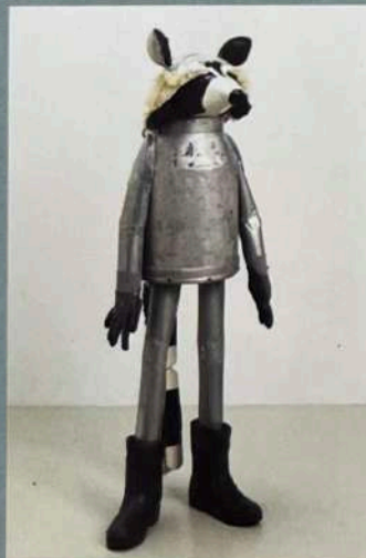
Galerie Tammen: MATTHIAS GARFF „Waschbär“, 2022, Milchkanne, Aluminium, Besen, Schöpfkellen, Gummistiefel, 130 x 60 x 50 cm, 6800 Euro