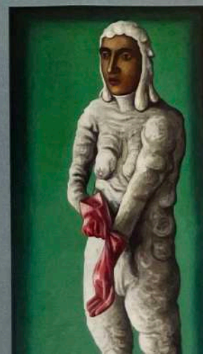
Feldbusch Wiesner Rudolph: PAUL PRETZER „Der Ruhe- stifter (Let's get it done)“, Öl auf Leinwand, 146 x 77 cm, 12000 Euro