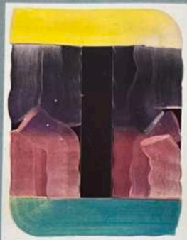
Galerie Bernhard Knaus: CIGDEM AKY „Ein langer Weg“, 2022, Acryl und Öl auf Baumwolle, 160 x 125 cm, 7125 Euro