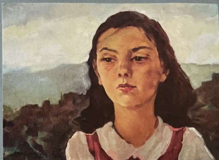
Dr. NÖTH Kunsthandel + Galerie: LOTTE LASERSTEIN „Mädchen aus der Provence“, 1951