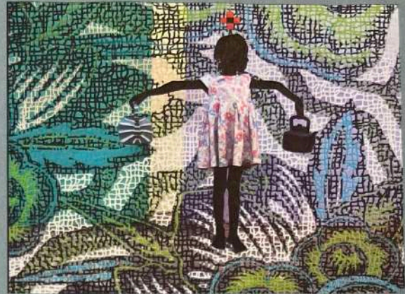
Artco: SAÏDOU DICKO „Opera Act 1 Luanda“, 2022, Tinte auf Fotografie und digitaler Collage, 75 x 100 cm, 4500 Euro