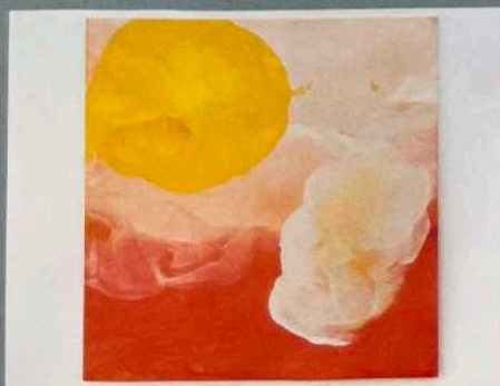
Galerie Gilla Lörcher: JOANNA JONES „It cut through blood #3“, 2021, Ei- Tempera auf Leinwand, 160 x 160 cm, 11200 Euro