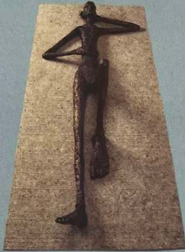
Mianki Gallery: TINA HEUTER „Liegender“, 2001, Bronze, Höhe 160 cm, 21000 Euro